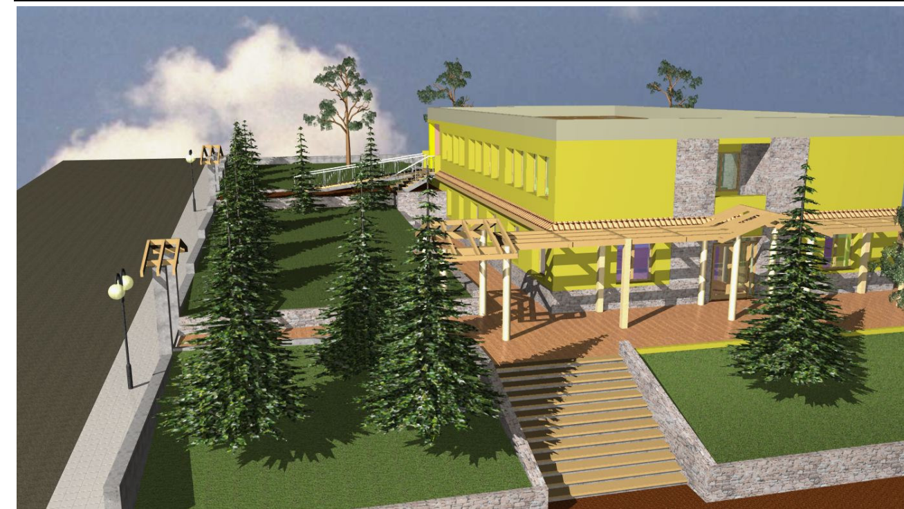
Tav. 9-c Planimetria Quotata scala 1:50

Geom. Antonino Giglio Ing. Giuseppe Verde Geol. Salvatore Dicuzzo Liotto Ing. J. Vincenzo Giglio Ing. Salvatore Consoli